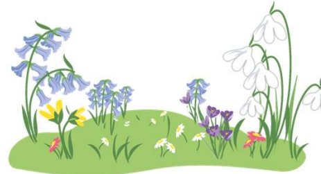
las flores crecen