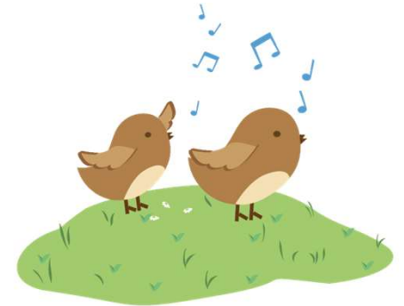
los pájaros cantan