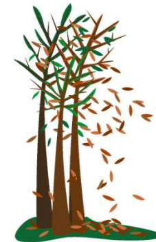
los árboles pierden sus hojas